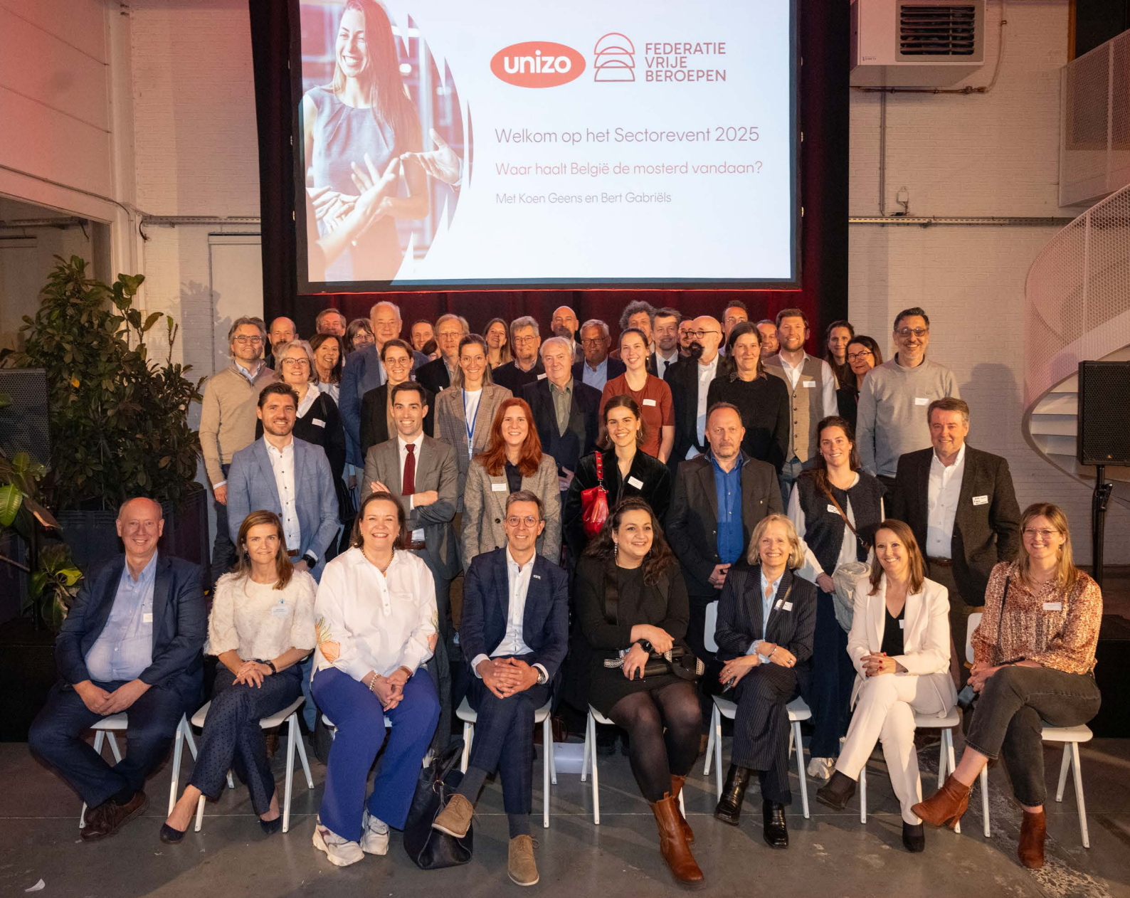
Groepsfoto deelnemers UNIZO-FVB-Sectorevent 2025